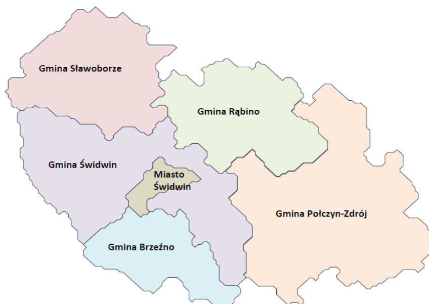
Rys. nr 2.1 Obszar Lokalnej Grupy Działania – „Powiatu Świdwińskiego”

Obszar realizacji LSR to obszar spójny przestrzennie i administracyjnie. Obszar LGD – „Powiatu Świdwińskiego” zajmuje teren 1 093 km 2 , obejmuje on cały powiat świdwiński (porównaj z mapą I.2.1 oraz tabelą nr I.2.1), w skład którego wchodzi: cztery gminy wiejskie: Brzeźno, Rąbino, Sławoborze, Świdwin , jedna gmina miejsko-wiejska: Połczyn-Zdrój i od 2014 roku również jedna gmina miejska – Świdwin i obejmuje łącznie 203 miejscowości.